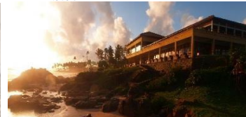
5 & 6泊目：ジェットウイング・ライトハウス