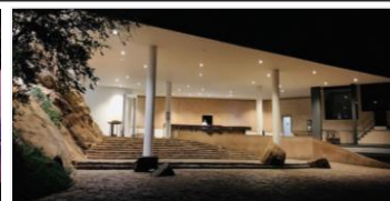
2 & 3泊目：ヘリタンス・カンダラマ