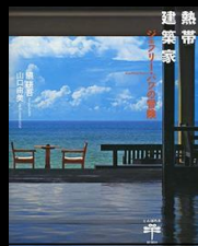
熱帯建築家【新潮社】

スリランカには、2008年に商店建築のバワ建築連載執筆取材で初めて訪問。その後、定期的にバワ取材を重ね、2016年にバワの建築を網羅した待望のガイドブックを出版。