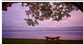
1泊目：ジェットウイング・ラグーン