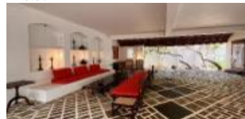
4泊目：ルヌガンガ & No.5